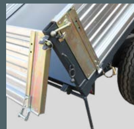
Hintere Rückwand mit Pendelverschluß und Eckstehern (nicht beim E15).

Alle Preise sind Nettopreise ohne Abzug und verstehen sich zzgl. MwSt. und zzgl. Fracht! Zzgl. TÜV-Einzelabnahme (technische Datenblätter werden gestellt). Änderungen und Irrtümer vorbehalten. Abbildungen ähnlich. Alle Angaben ohne Gewähr!