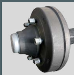
Verstärkte Bremstrommel aus Gusseisen.