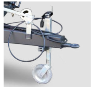
Höhenverstellbares Stützrad. Optional für E15 bis E35, Serie bei E52 und E62.